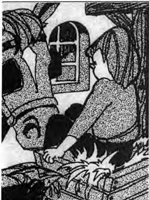
Häst skulle lånas för transporten.