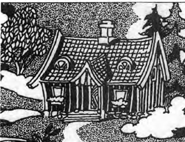
Den lilla grå stugan.

När de var framme vid prästgården, sa Jonas till Leon ännu en gång, att vara försiktig när