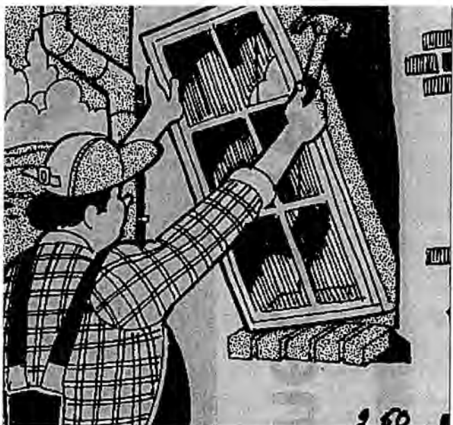
Det är inte bara när man ska bygga.