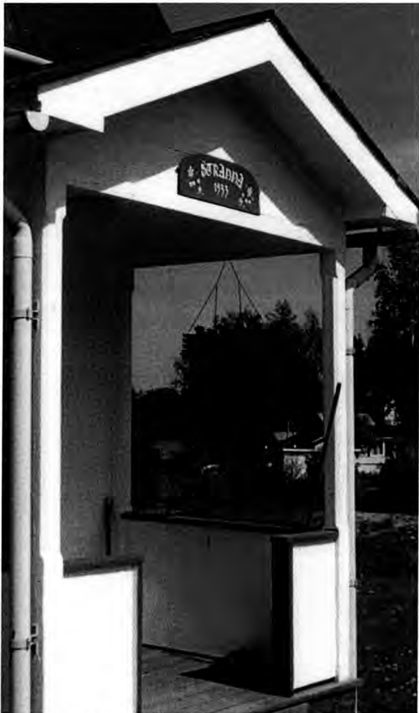
Den gamla bron på Stranna.

Efter att pappa bosatte sig på Stranna, så fick jag ju tillbringa mer tid på Stranna. Först medan farmor först bodde kvar och senare