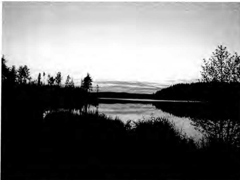
Solnedgångarna på Stranna, finns det något vackrare?!