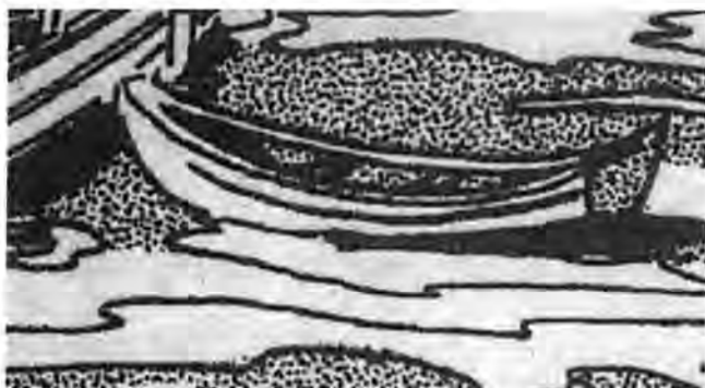
Soffan skulle lastas på båten.

- Ja, ja det är hårda bud när du ska bestämma