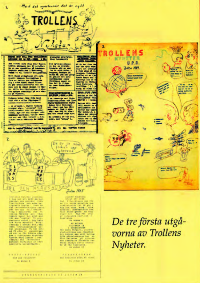
De tre första utgåvorna av Trollens Nyheter.