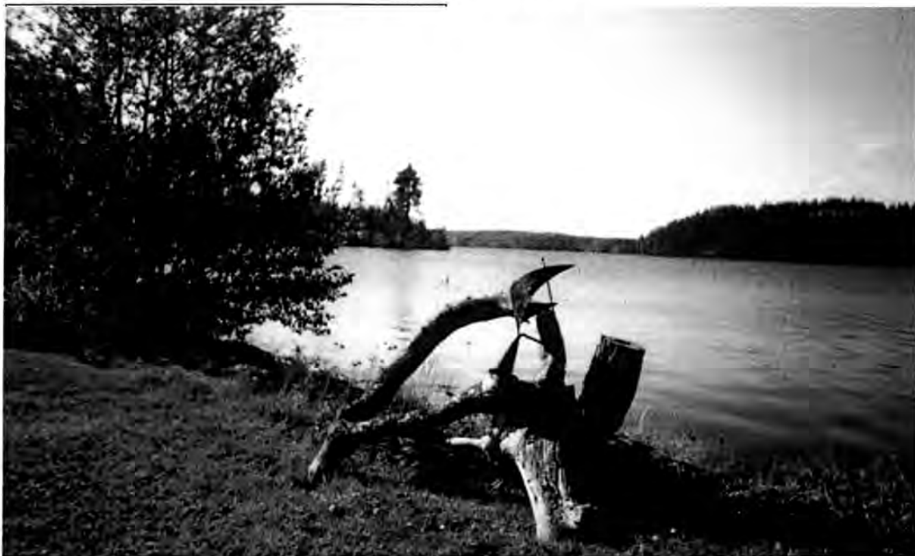
Det gamla soluret.

Då var jag på väg ned till Trollhättan för att träffa min pappa efter att ha bott den första månaden hos min mormor och morfar uppe i Väja.