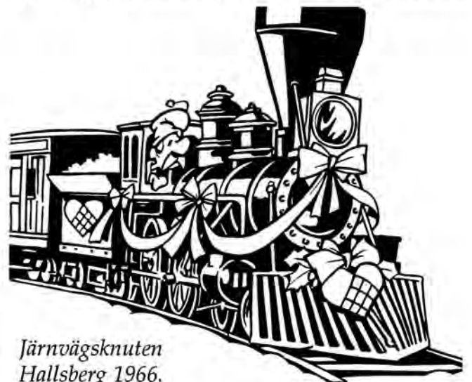
Järnvägsknuten Hallsberg 1966.

Våren 1966 gick familjens färd till den stora järnvägsknuten Hallsberg för jobb på Nerikes Allehanda. Eftersom NA också köpt Motala Tidning och man vid den tiden hade en stor sommarutställning i Vadstena fick jag förflyttning dit, med ny flytt som följd. I Motala