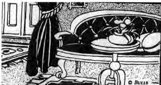
Så såg den ut, fästmanssoffan.