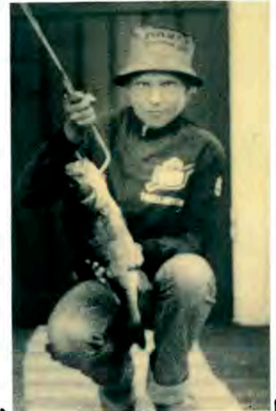
REKORDHÅLLAREN med sin storfångst

ders och konstaterar samtidigt att han också är Trollsykienmästare i fiske.